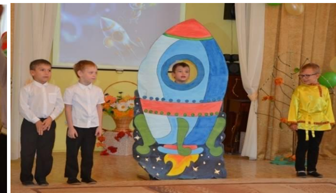
В конце праздника детей ожидало вручение дипломов победителей конкурса «Сызрань – мой город родной!»