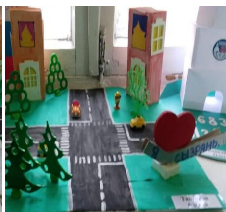
Праздник «Мы любим свой город!»