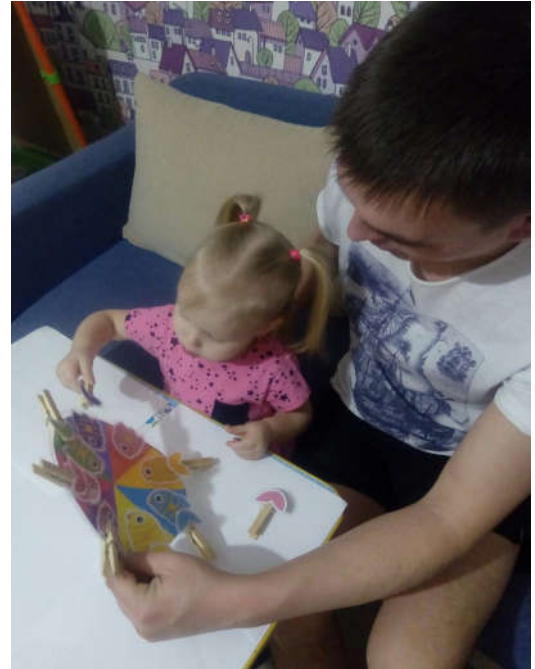
Д/игра «Подбери по цвету»