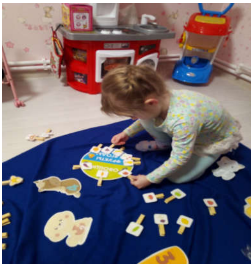
«Овощи и фрукты»