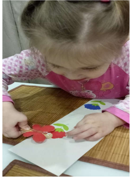
Д/игра «Подбери по цвету»