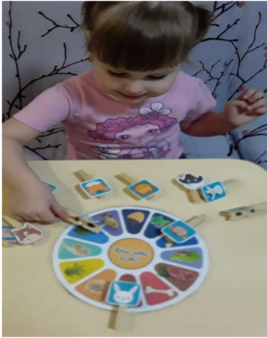
«Кто что ест?»