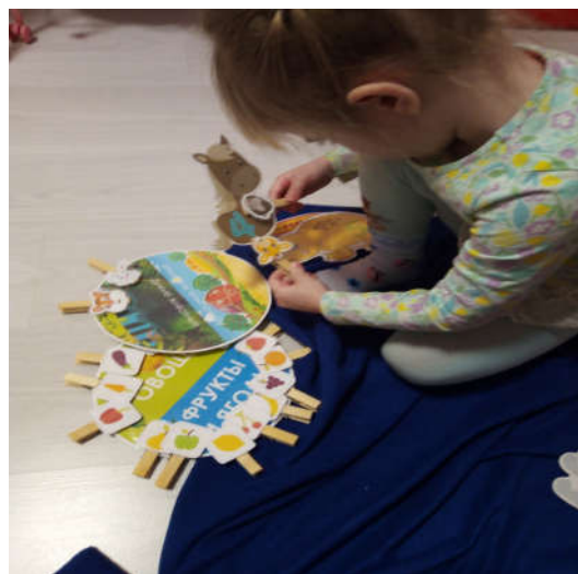
«Домашние и дикие животные»