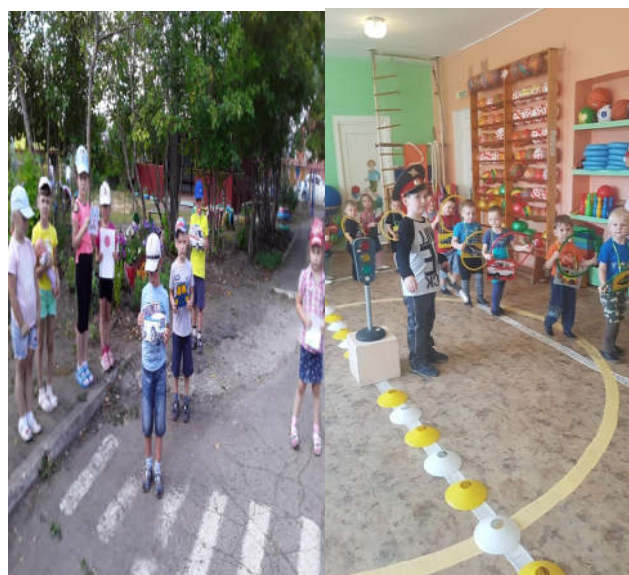
Развлекательные мероприятия «Зеленый огонек» №8