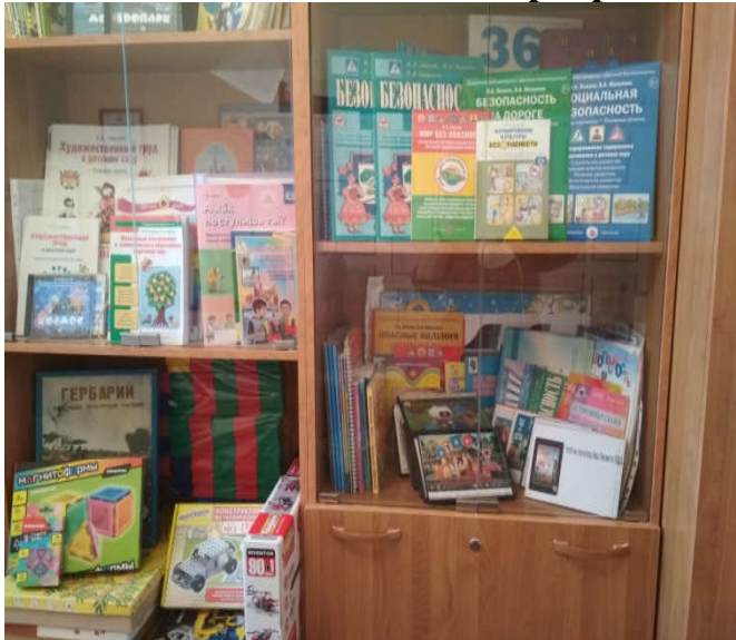
Учебно-методические пособия №1