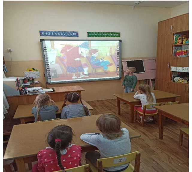
Интерактивная доска №2