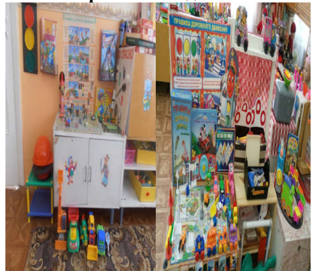
Игровые центры №4