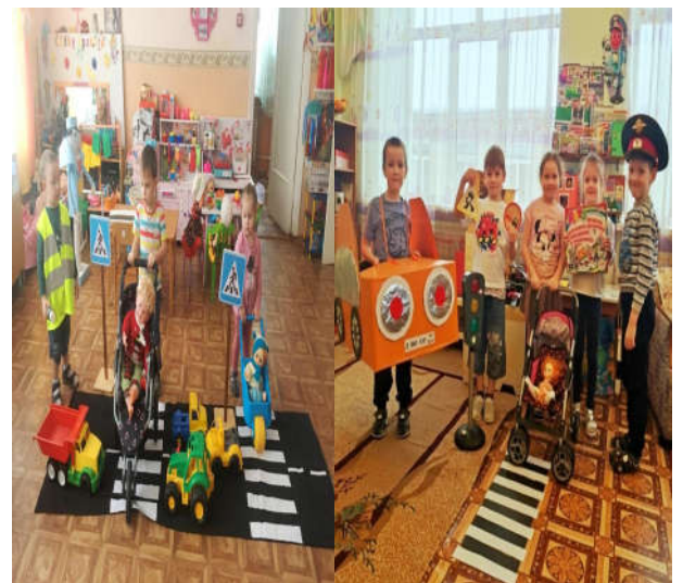
Атрибуты для с/ролевых игр №6