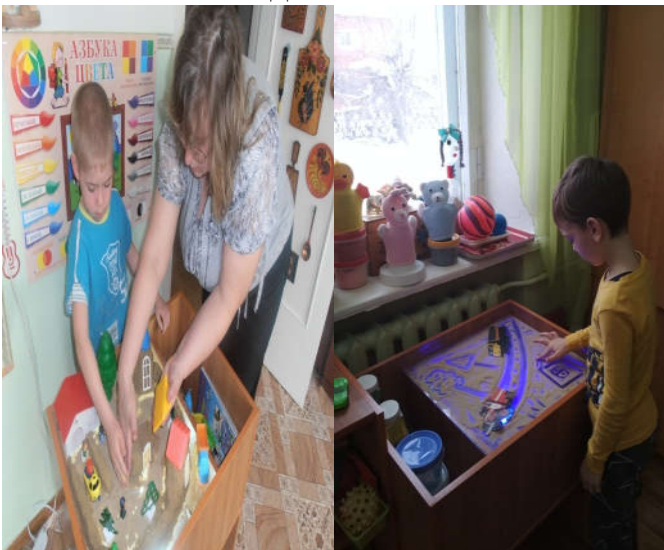
Стол с подсветкой «Весёлые песчинки» №3