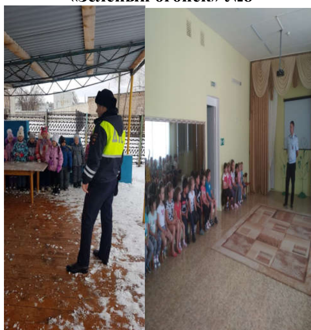
Квест – игры и встречи с инспектором ПДД №10