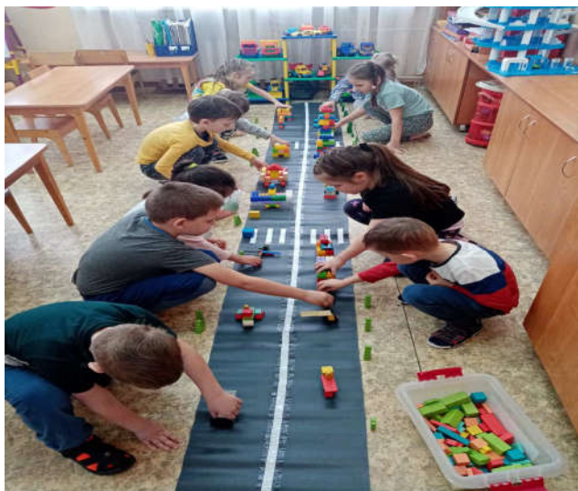
Игровые центры №5