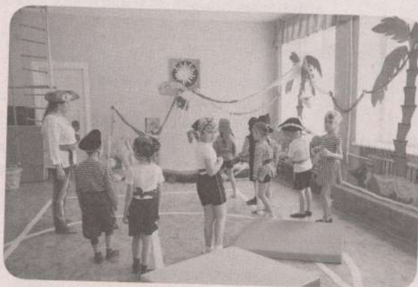
«Джунгли» → с. 64