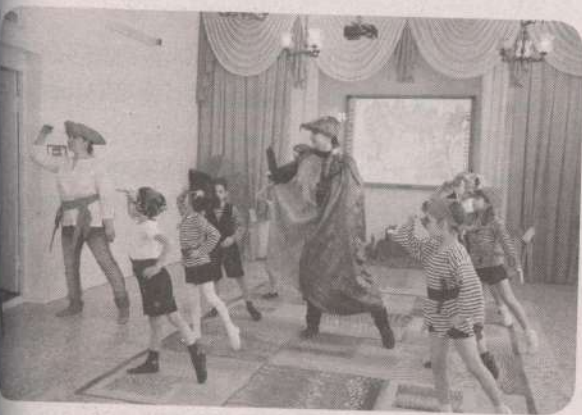
Ритмопластика «Хорошее настроение» → с. 66