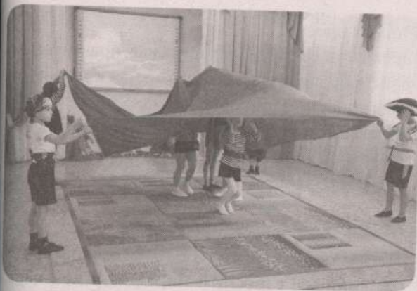
Игра на координацию движений «Шторм» → с. 64