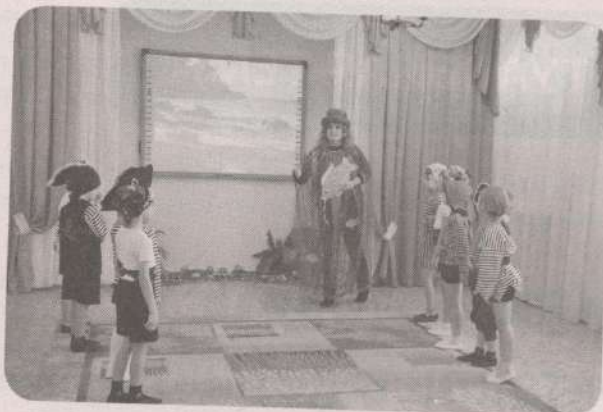
«Подводное царство» → с. 61