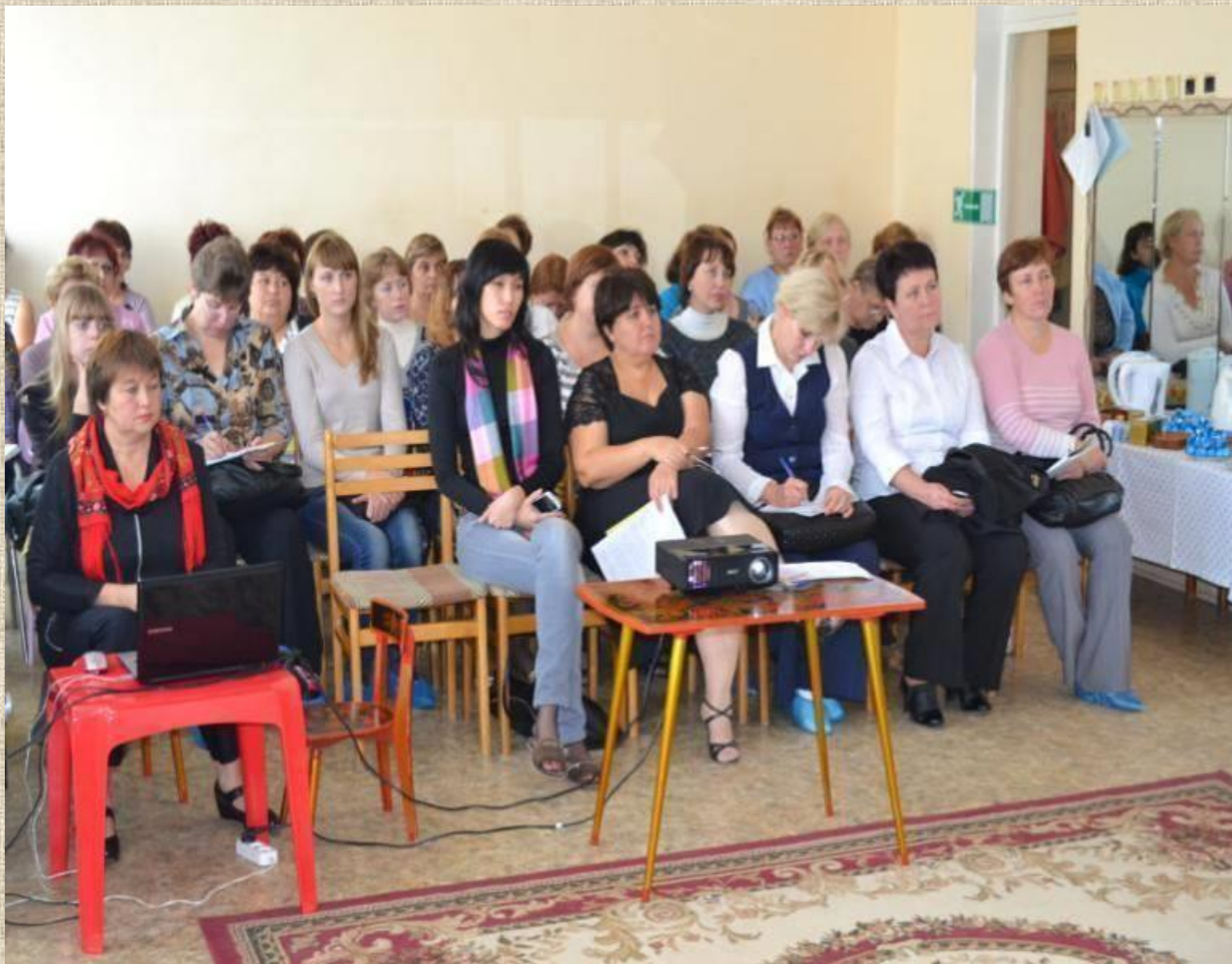
Конференция «Инновационный потенциал и особенности реализации комплексной образовательной программы дошкольного образования «Мир открытий»