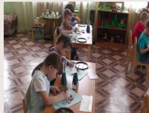
Ряд за рядом.