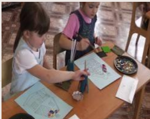
«Кирпичики» выкладываем последовательно