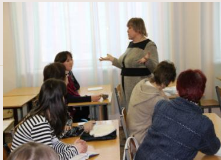
Семинар «Изучение системы дидактических принципов деятельностного метода Л.Г. Петерсон»