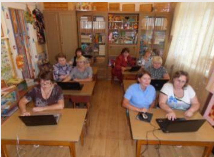
Творческий практикум «Разработка сценария занятия в технологии «Ситуация»»