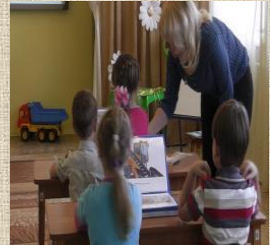
В игре «Компьютер» дети обозначали виды транспорта символом.