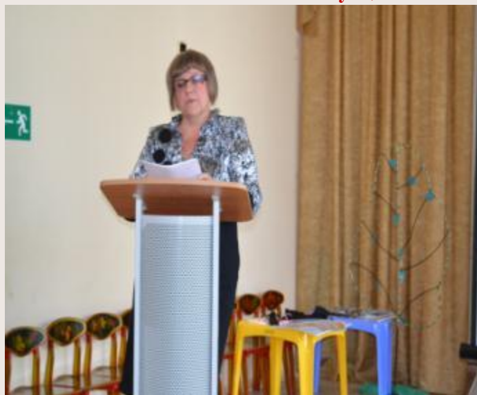
Конференция «Инновационный потенциал и особенности реализации комплексной образовательной программы дошкольного образования «Мир открытий»