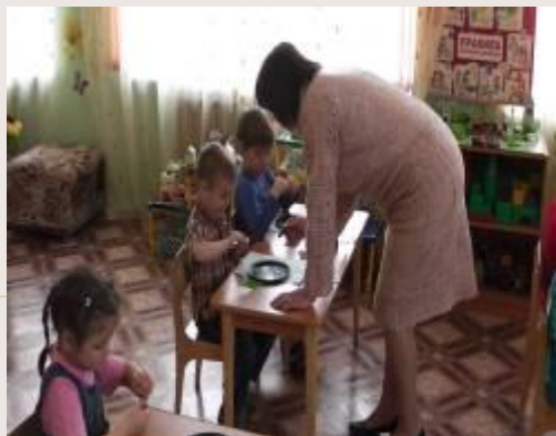
«Строительство» дома начинают с нанесения клея на небольшой участок дома.