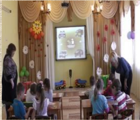
Воспитанники специальные машины выкладывали по частям в игре «Сложи картинку».