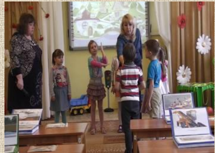
Для создания ситуации успеха учитель –логопед и воспитатель взяли в руки микрофоны и как корреспонденты брали интервью у детей для дошкольного канала