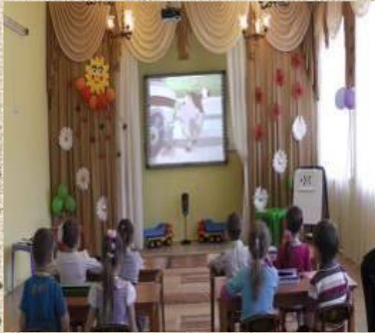
Смешарики показали видео «Автомобили специального назначения»